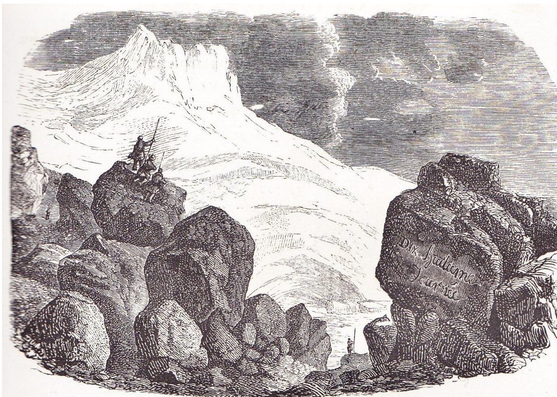
EXPÉDITION A LA VOUTE DU GLACIER.